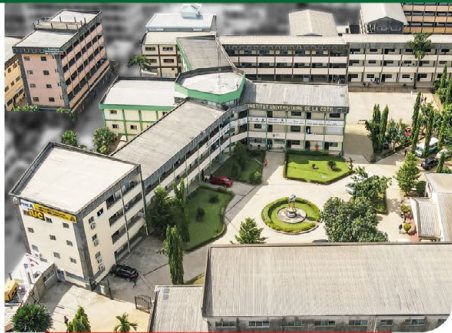
Campus Principal de Logbessou