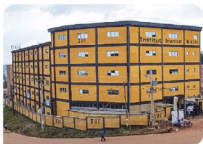
Campus de Dschang