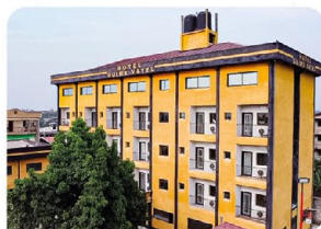
Hôtel d'Application de VATEL